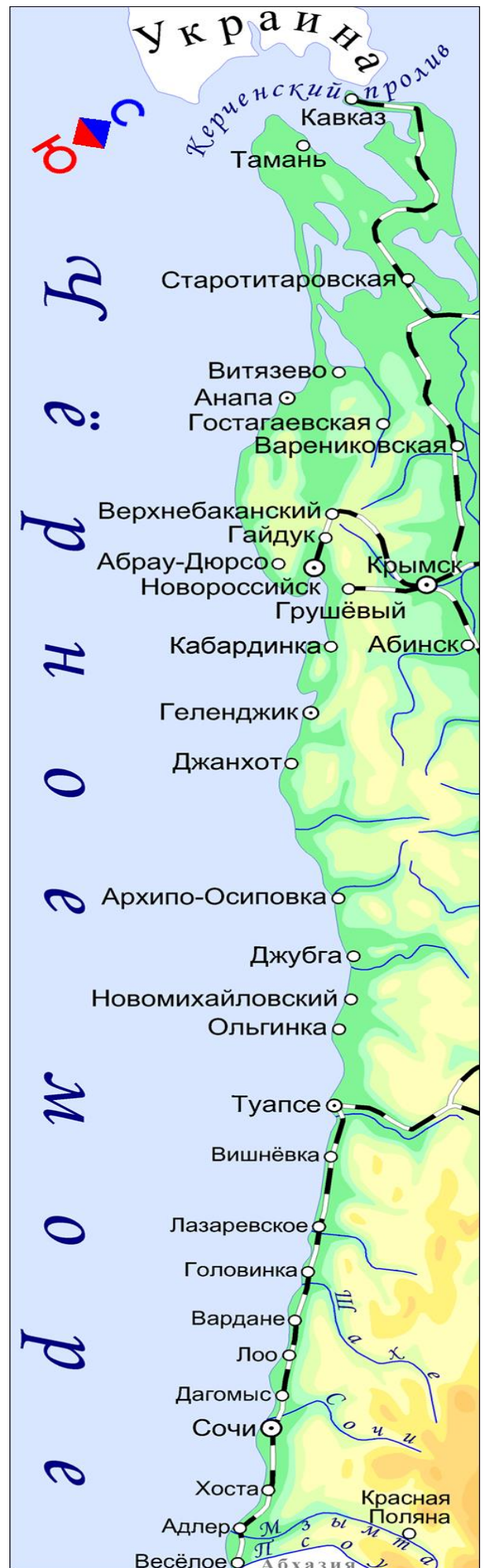
Информация о населённых пунктах