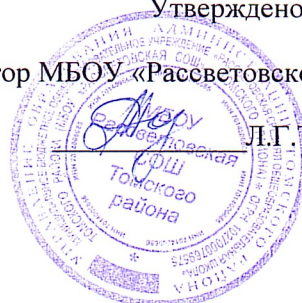
График проведения родительского контроля в 2023-2024 учебном году